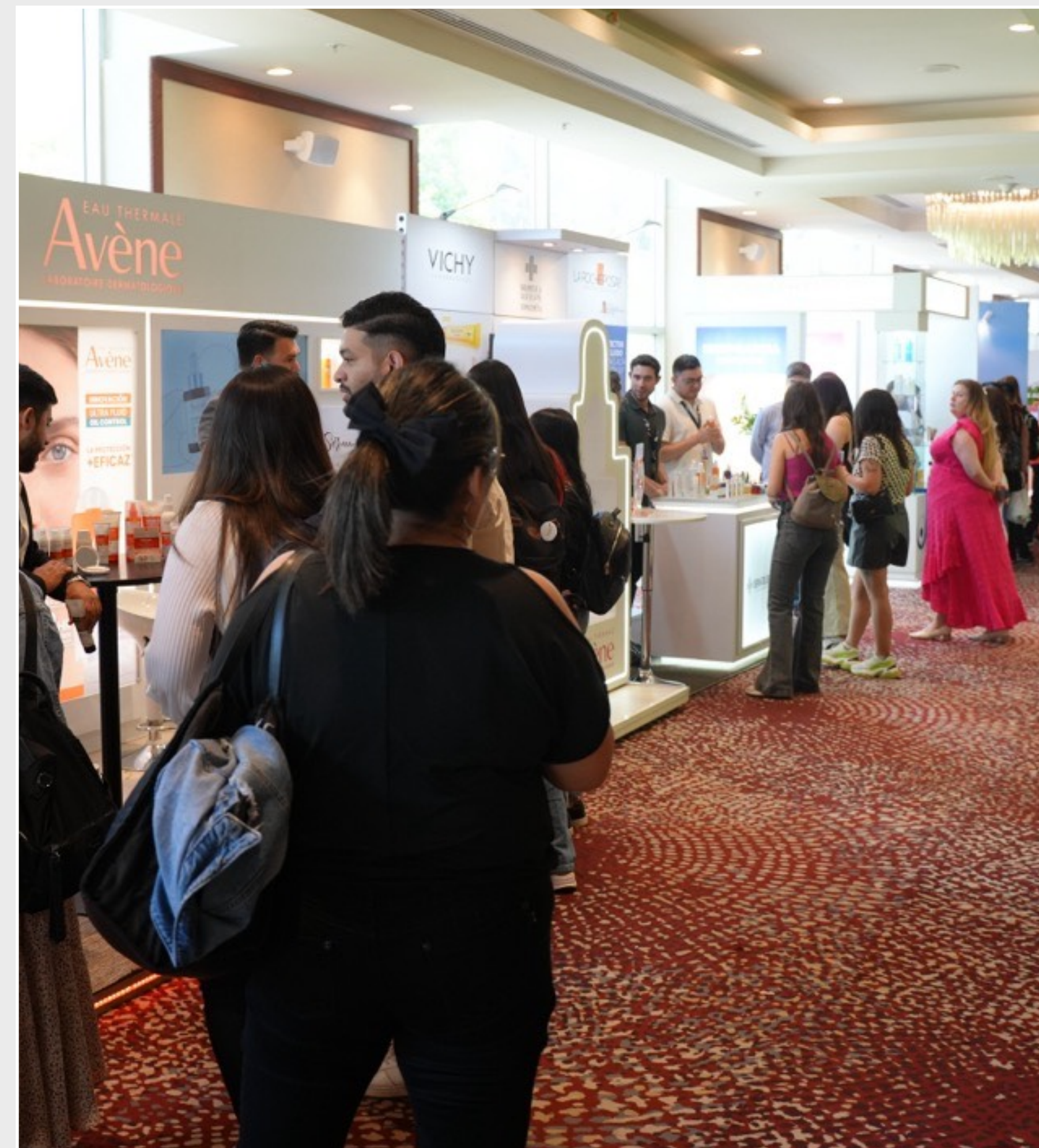
Referencia implementación stand

En Santiago, el montaje del evento se realiza íntegramente el martes 25 de noviembre, de 10:00 a 18:00 hrs.